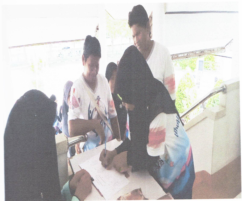
ลงทะเบียน