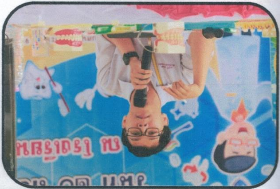
កិច្ចការស្ត្រីក្នុងសហគមន៍