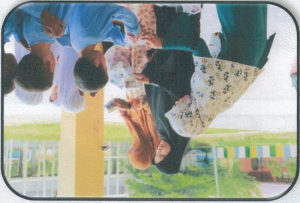
ស្ត្រីជនប្រទេសកម្ពុជា