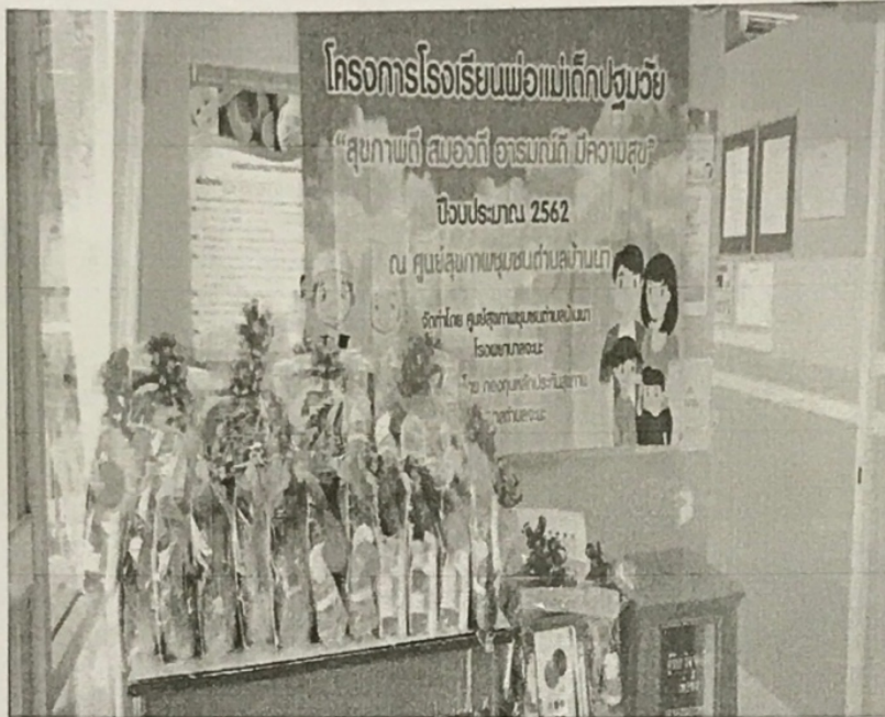
ป้ายโครงการ โรงเรียนพ่อแม่สุขภาพดี สมองดี อารมณ์ดี มีความสุข