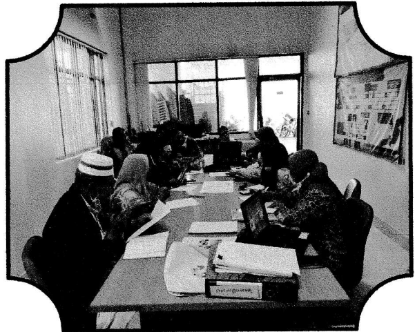
ประชุมครั้งที่ ๓/๒๕๖๓ วันที่ ๒๙ กันยายน ๒๕๖๓ ติดตามการดำเนินงานและสรุปภาพรวมของกองทุน