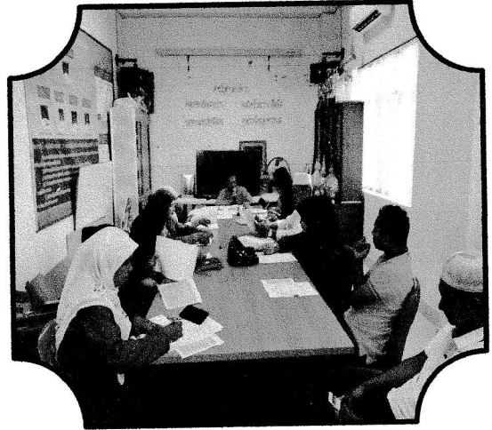
ประชุมครั้งที่ ๖/๒๕๖๒ วันที่ ๒๒ ตุลาคม ๒๕๖๒ สรุปการดำเนินงานกองทุนฯ ๒๕๖๒