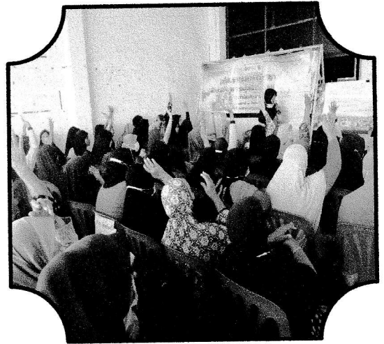
ประชุมเวทีประชาคมสุขภาพเพื่อรับฟังปัญหาและความต้องการเกี่ยวกับสุขภาพ ของประชาชนในพื้นที่ตำบลบางตาหลวง