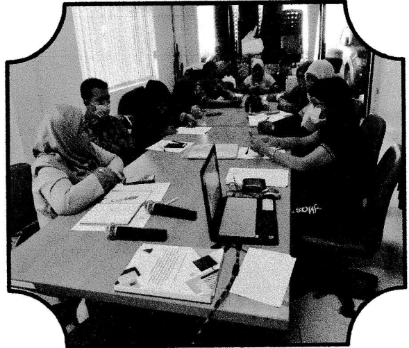
ประชุมครั้งที่ ๑/๒๕๖๓ วันที่ ๑๖ มีนาคม ๒๕๖๓ พิจารณาอนุมัติและติดตามการดำเนินงานกองทุน