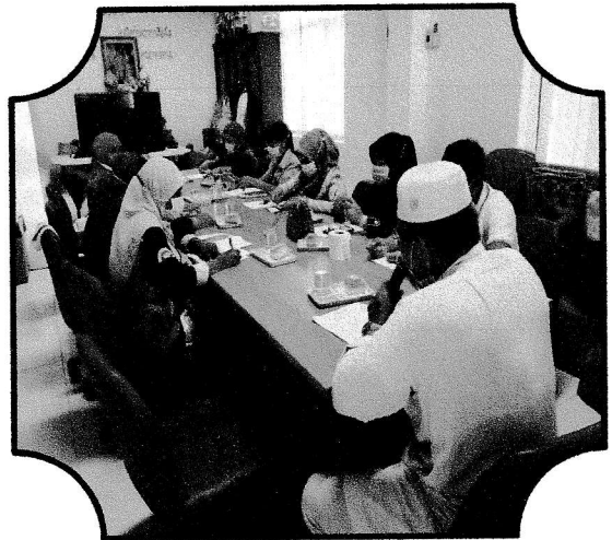
ประชุมครั้งที่ ๒/๒๕๖๓ วันที่ ๒๓ มิถุนายน ๒๕๖๓ พิจารณาอนุมัติและติดตามการดำเนินงานกองทุน