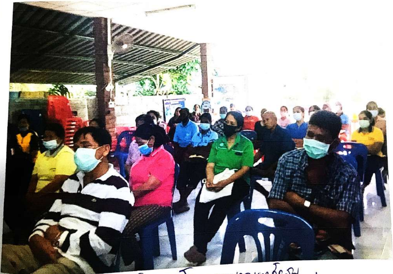
การประชุมโรงเรียนวัดหนองหญ้าไซ ตำบลหนองหญ้าไซ อำเภอเมืองสุพรรณบุรี