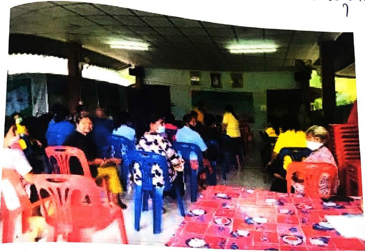
ห้องประชุมโรงเรียนวัดหนองหญ้าไซ ตำบลหนองหญ้าไซ อำเภอเมืองสุพรรณบุรี