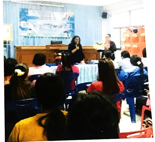
กิจกรรมกลุ่ม ผู้ปกครองมีความตั้งใจในการร่วมกิจกรรม