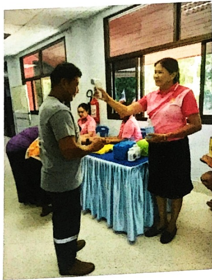
การคัดกรองผู้เข้าร่วมโครงการก่อนลงทะเบียน