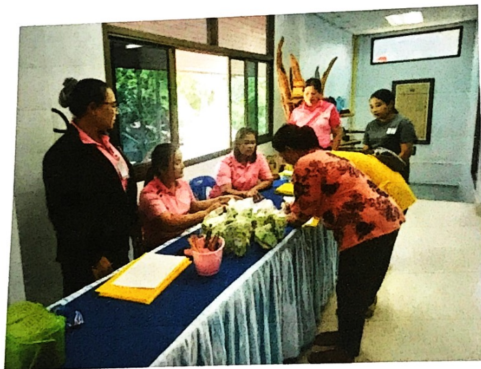
ลงทะเบียน รับเอกสาร พร้อมอาหารว่าง