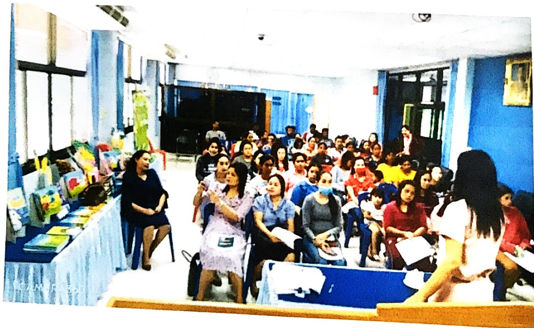
ผู้ปกครองให้ความร่วมมือเป็นอย่างดี