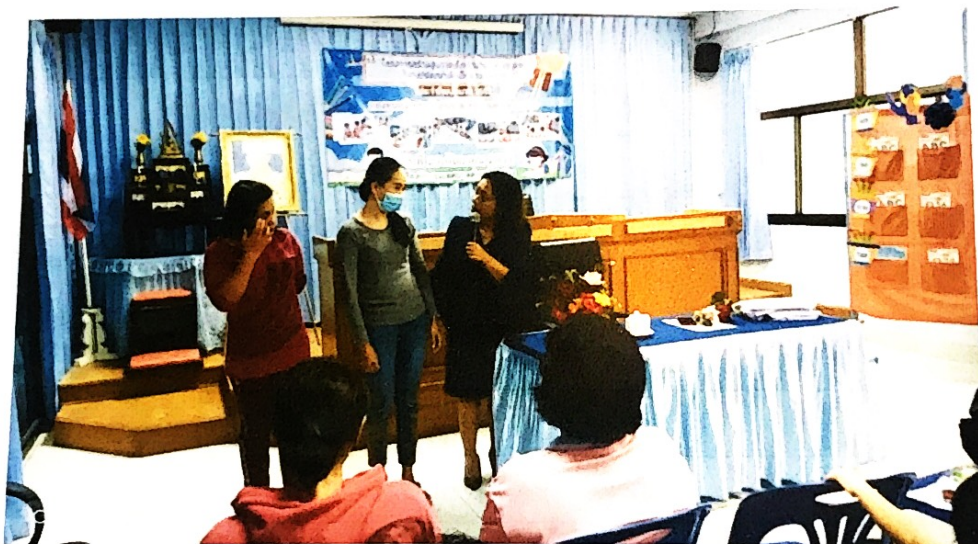
ผู้ปกครองให้ความร่วมมือเป็นอย่างดี