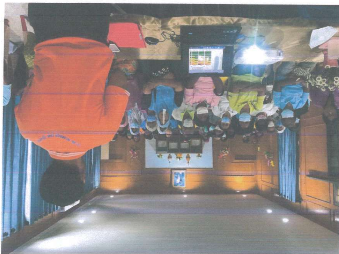
ภาพแสดงการแสดงของนักเรียนโรงเรียนอนุบาลนครราชสีมา โดยนักเรียนในชุดสีต่างๆ กำลังแสดงบนเวที