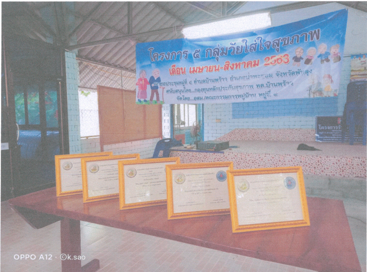
ภาพ ประกวดครัวเรือนต้นแบบ