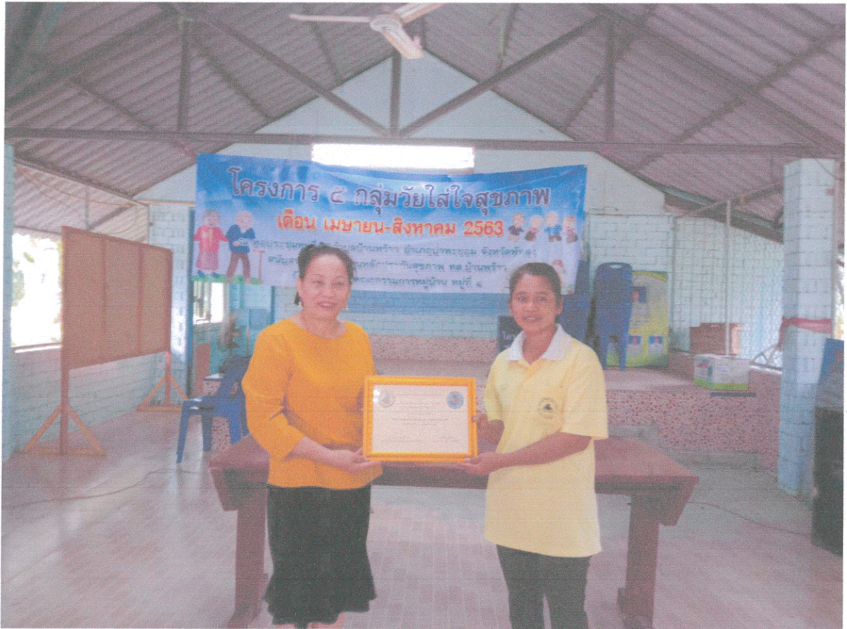
ภาพ ประกวดครัวเรือนต้นแบบ