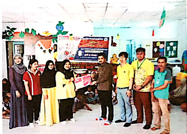
กิจกรรมที่ ๓ จัดทำสื่อประชาสัมพันธ์การเฝ้าระวัง ป้องกันและควบคุมโรคติดเชื้อไวรัสโคโรนา (COVID-๑๙)