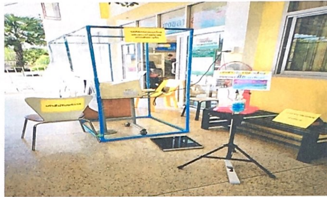
จัดทำอ่างล้างมือเพื่อให้บริการแก่ประชาชนในสถานที่ที่จำเป็นต้องการดำรงชีพของประชาชน