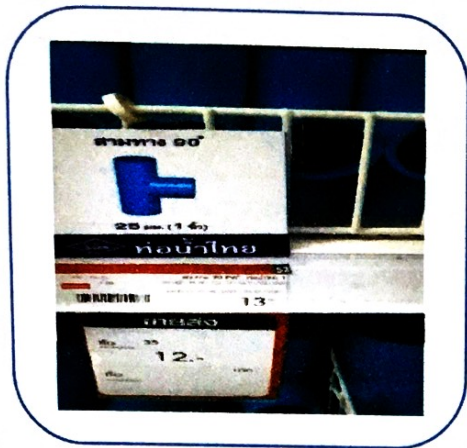
๑๓. สามทาง ๑ นิ้ว (ราคา ๑๓ บาท)