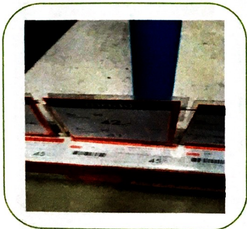
๑๑. ท่อประปา PVC ขนาด ๔ หุน (ราคา ๔๕ บาท)