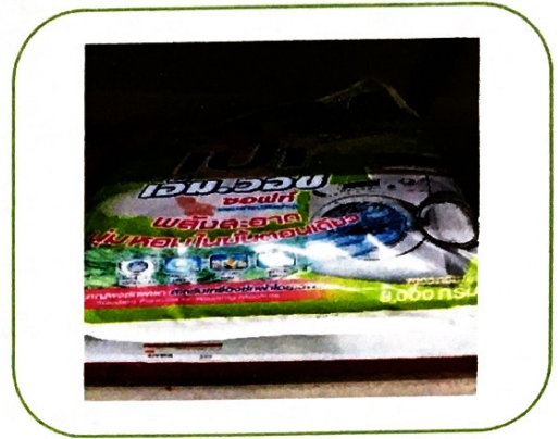
๘. ผงซักฟอกเปาเอี๋มวอช ถุงใหญ่ (ราคา ๓๙๙ บาท)