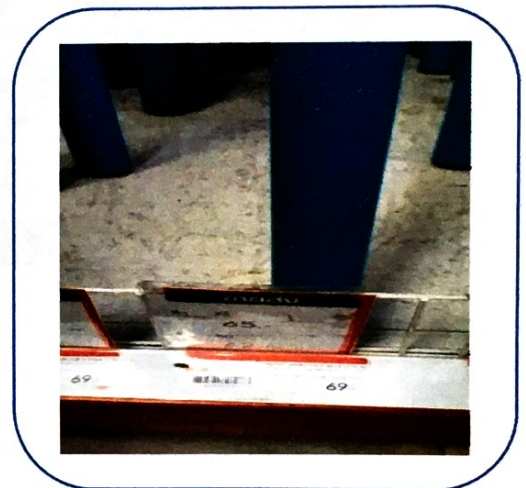
๑๐. ท่อประปา PVC ขนาด ๑ นิ้ว (ราคา ๖๙ บาท)