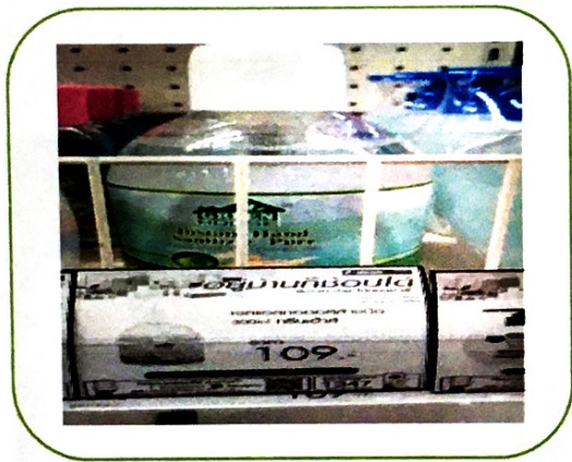
๓. เจลแอลกอฮอล์ล้างมือ ๓๐๐ ml กรีนแฮร์ส (ราคา ๑๐๙ บาท)