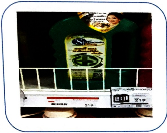
๗. น้ำยาฆ่าเชื้อ/ทำความสะอาดขนาดใหญ่ (ราคา ๒๑๙ บาท)