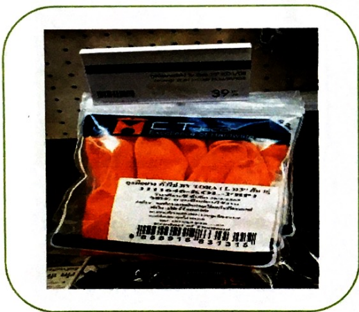
๙. น้ำถุงมือยาง (สีส้ม) (ราคา ๓๙ บาท)