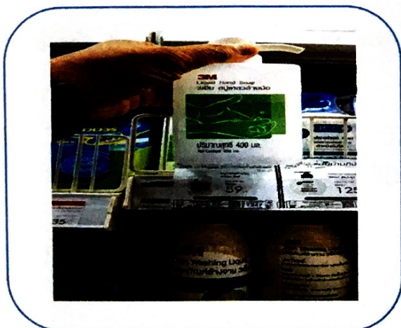
๕. สบู่เหลวล้างมือ ๔๐๐ ml (๓M) (ราคา ๕๙ บาท)