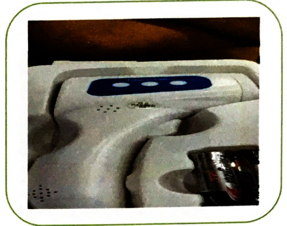
๒. เครื่องวัดอุณหภูมิ (เครื่องละ ๒,๒๐๐ บาท)