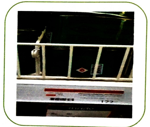
๑๖. กาวกระป๋องใหญ่ (ราคา ๑๒๒ บาท)