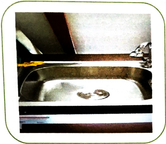
๑. ครุภัณฑ์ซิงค์ฝัก ๑B TNS ๑๐๕๐๐ SS (อ่างละ ๙๕๐ บาท)