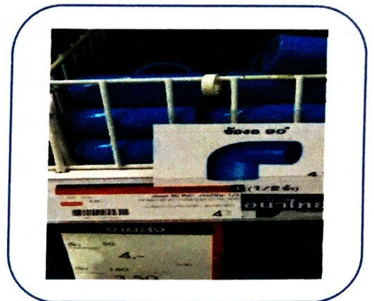
๑๔. ข้ออ ๔ หุน (ราคา ๔.๕๐ บาท)