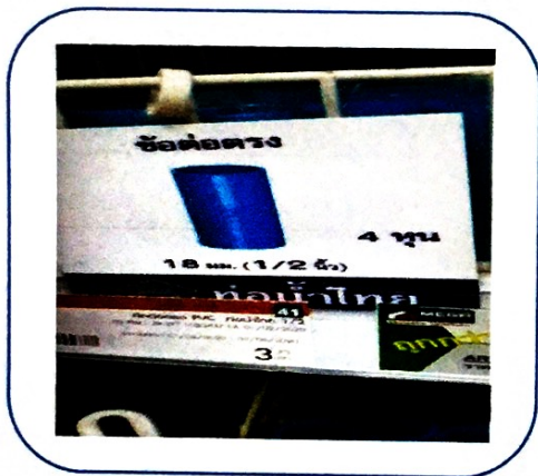
๑๕. ต่อตรง ๔ หุน (ราคา ๓.๗๕ บาท)