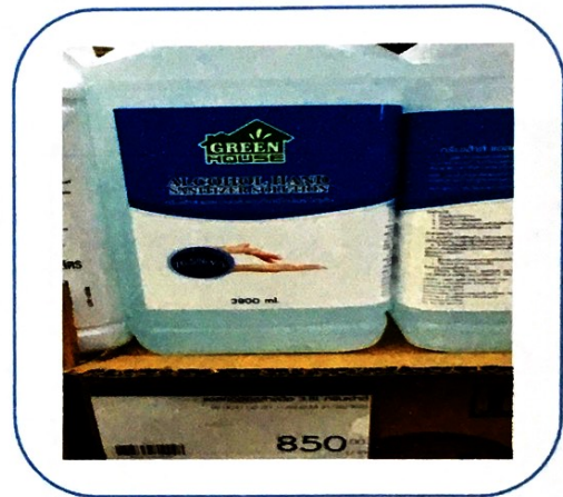
๔. แอลกอฮอล์ล้างมือ ๓.๘L กรีนแฮร์ส