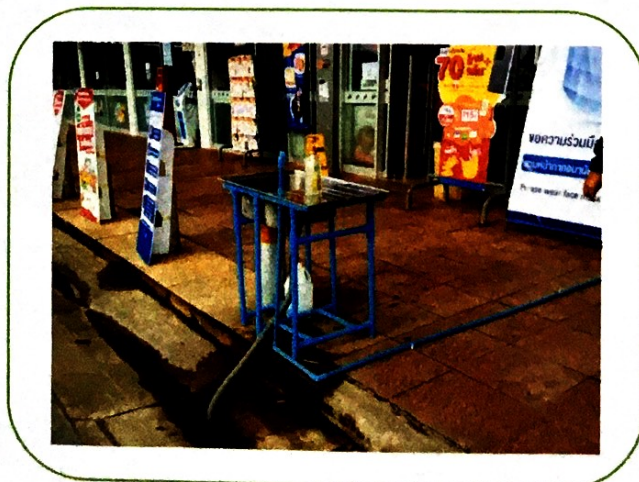
ตัวอย่างอ่างล้างมือ