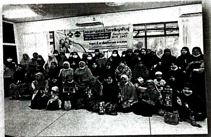
มอบผ้าถุงหลังจากได้รับการตรวจ มะเร็งปากมดลูก Pap smear ให้กับกลุ่มเป้าหมาย