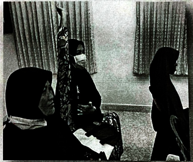
ให้ความรู้พร้อมสาธิตการตรวจมะเร็งเต้านม โดย วิทยากร