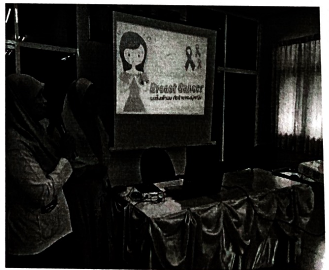
แลกเปลี่ยนเรียน รู้ประสบการณ์ จากผู้ที่เป็นมะเร็งเต้านมและได้รับการรักษา