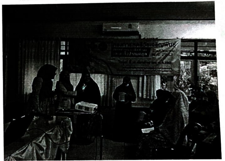
กิจกรรมตอบคำถาม และมอบรางวัลให้ผู้เข้าร่วมโครงการ