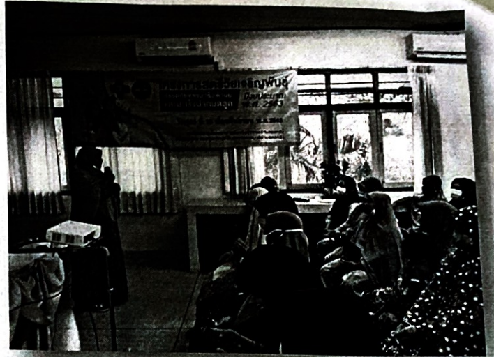
เปิดพิธีโดย ผอ. รพ. สต. ตอหลัง