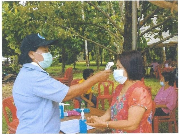
การคัดกรองในชุมชน