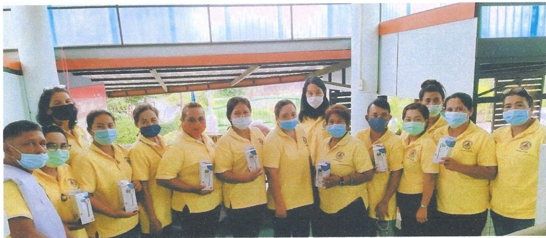
เทอร์โมมิเตอร์ วัดอุณหภูมิร่างกาย ระบบอินฟาเรด