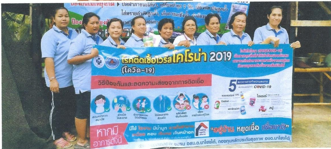
ประชาสัมพันธ์ในชุมชน