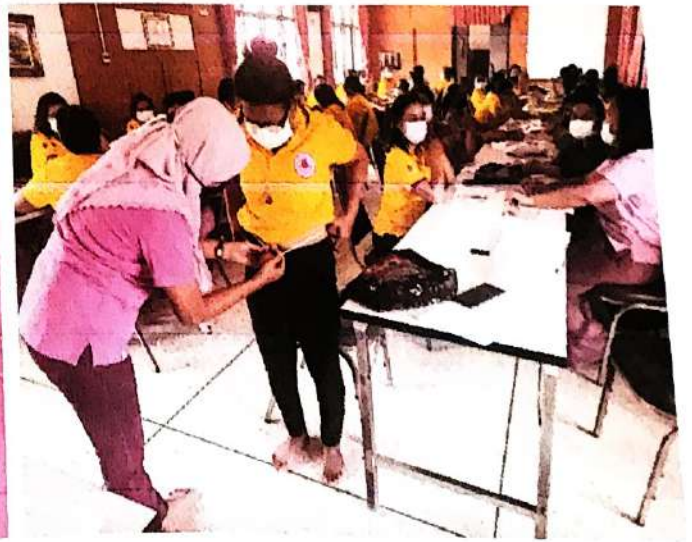
3. การประชุมเพื่อติดตามประเมินการเฝ้าระวังพฤติกรรมสุขภาพในกลุ่มเสี่ยงหลังจากการอบรม