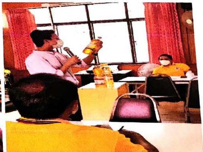
2. ดำเนินการคลินิกไร้พุง (DPAC) ให้ความรู้ในการปรับเปลี่ยนพฤติกรรมลดพุง จัดกิจกรรมกลุ่ม