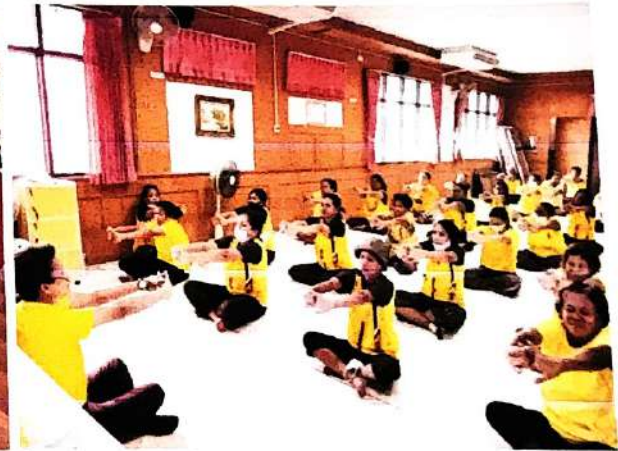
1. อบรมให้ความรู้แก่กลุ่มเสี่ยงในการปรับเปลี่ยนพฤติกรรมเพื่อลดพุง และค่าดัชนีมวลกาย