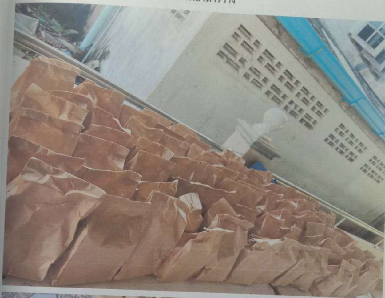
ภาพอาหารว่าง