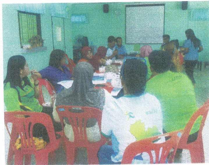
อาหารว่าง