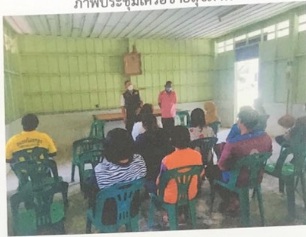
ภาพประชุมเครือข่ายสุขภาพ