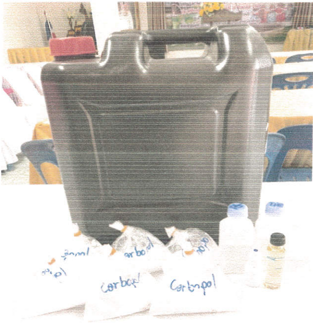
ภาพถ่ายวัสดุ อุปกรณ์ ป้าย โครงการป้องกันการแพร่ระบาดของโรคติดเชื้อไวรัสโคโรนา (COVID - 19)