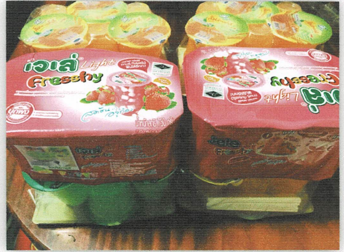
อาหารว่างพร้อมเครื่องดื่ม