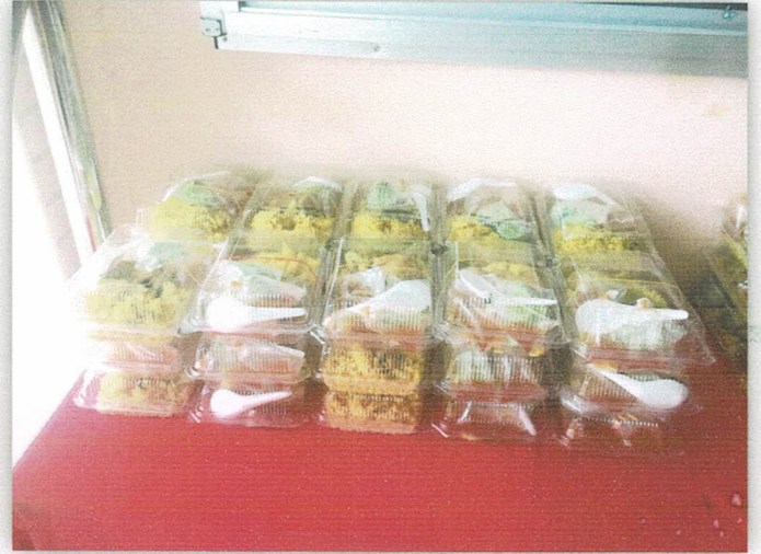
อาหารกลางวัน